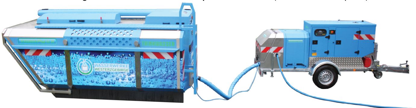
Bild unten: KTS mit angeschlossenem Trinkwassertransportbehälter AS 60 (Containerwechselsystem)